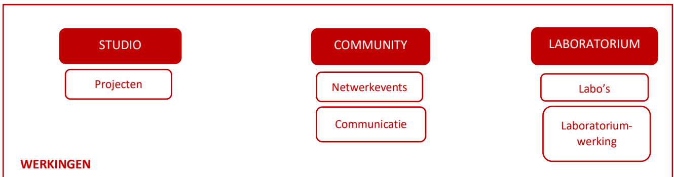
SCHEMA 2: SOM werkingen

Om alle activiteiten binnen SOM optimaal te kunnen coördineren en om de finaliteit en het opzet van activiteiten te verhelderen, organiseren we binnen SOM 3 werkingen (zie Schema 2 en bijlage 2).